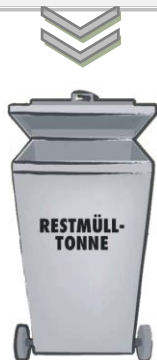
Poubelle Déchets Résiduels