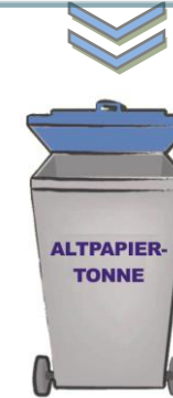
Poubelle Vieux Papier